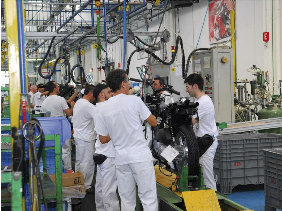
Empleados trabajando en la empresa

Las empresas se reúnen con las familias y se abren el territorio. Esto sucede gracias a las "Jornadas de puertas abiertas empresariales", una de las