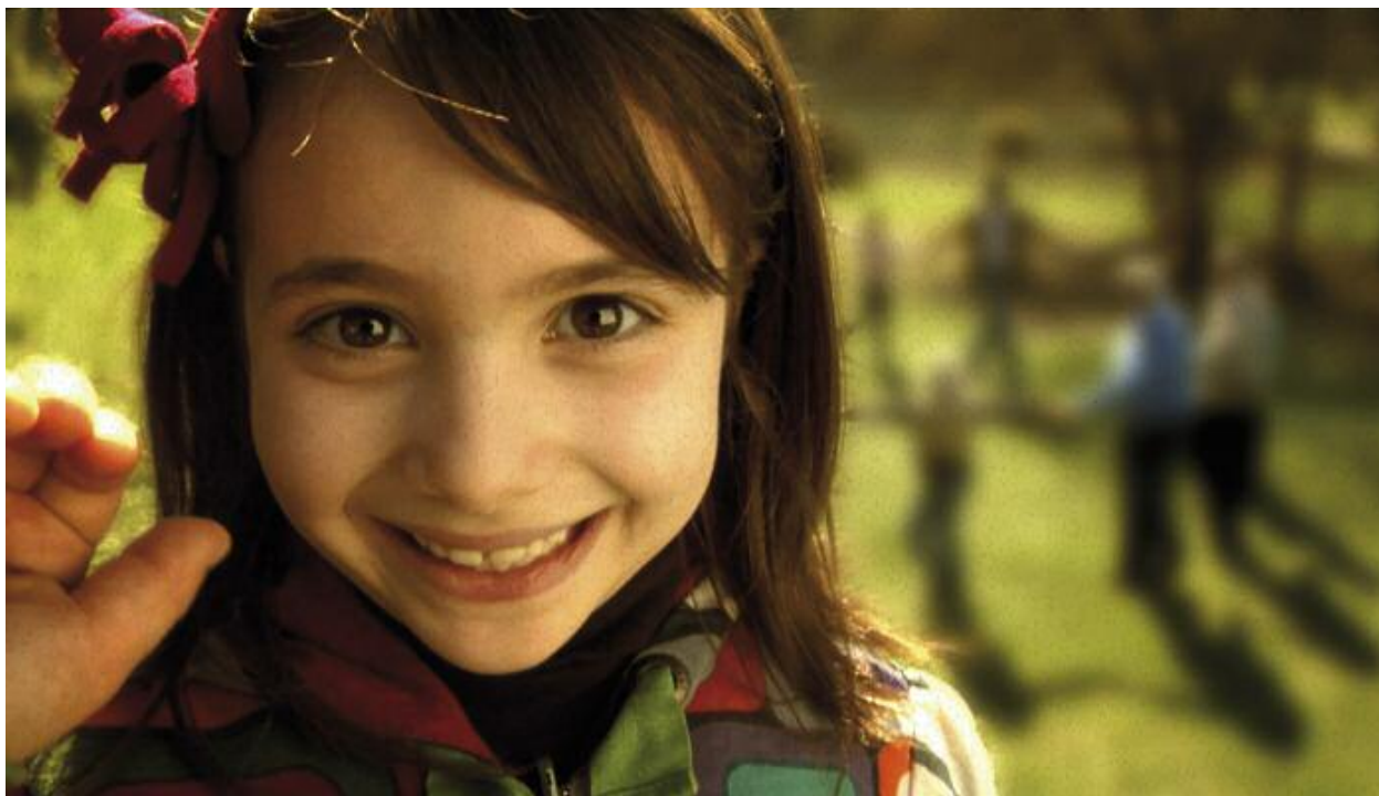
Un fotograma del spot para el encuentro mundial

El VII Encuentro Mundial de las familias está listo para entrar en las casas de todo el mundo. Ha sido realizado en cinco idiomas: italiano, inglés, francés, español y portugués, el spot oficial del evento que, partiendo de la simbología arquetípica y universal del árbol, narra la importancia de la acogida y de la armonía como valores básicos de cualquier familia y, por extensión, de la familia global por excelencia, la Iglesia. Hombres, mujeres, niños de todas las edades y procedencias se agarran en un corro que representa un mundo multiétnico, acogedor y armónico. Todos juntos felices a la espera del Papa Benedicto XVI. En vídeo ha sido patrocinado por la Fondazione Milano Famiglie 2012 y ha sido realizado gracias a la contribución creativa y operativa ofrecida por la agencia Ogilvy & Mather Advertising y por la productora Cineteam de Roma. Se trata de un vídeo de pocos segundos creado con el objetivo de invitar a Milán a las familias italianas y del mundo. El spot, con un mensaje orientado también al mundo laico, habla de rostros, de fiesta, de