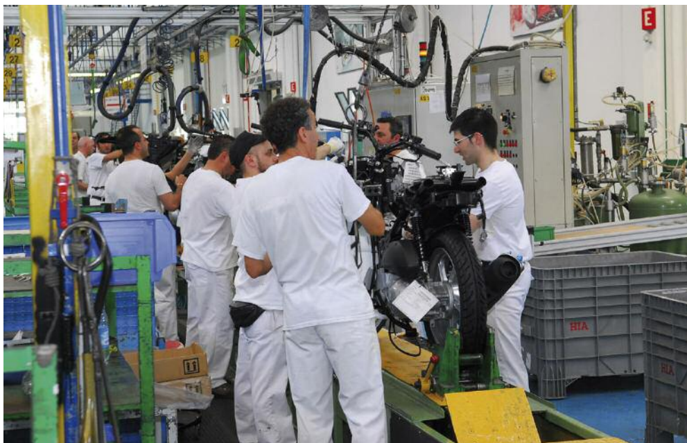
Travailleurs à l'oeuvre dans une entreprise